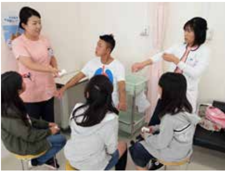
看護を体験してみよう！