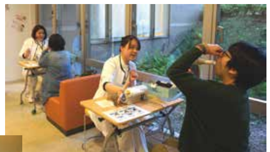
あなたの肺年齢いくつ?