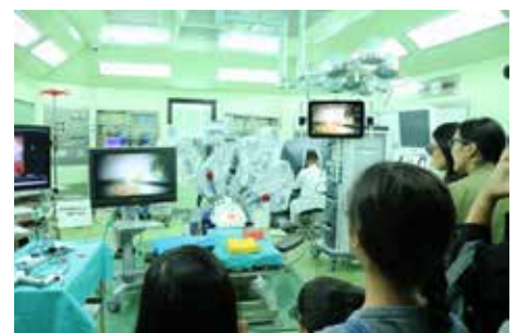
手術室を覗いてみよう!