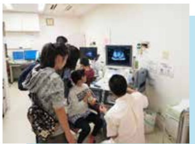
超音波 (エコー) って何? 超音波検査体験