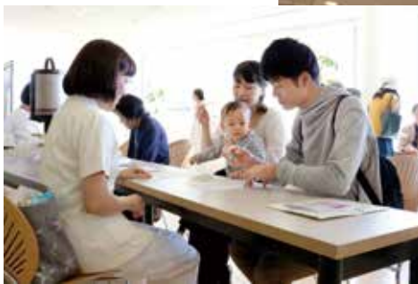
美味しいものには畏がある!?