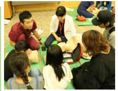
AEDを使って心肺蘇生を学ぼう