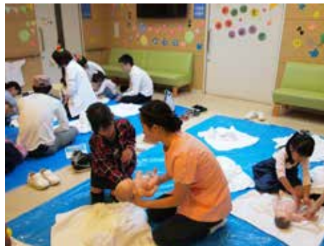
赤ちゃんのお世話をしよう！