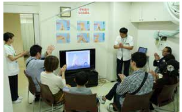
手洗い上手にできたかな?