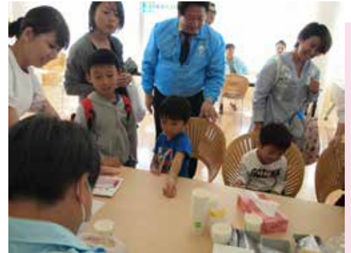
歯の広場 唾液テスト