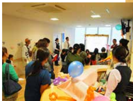
安全な医療ってなあーに? クイズでわかる医療安全