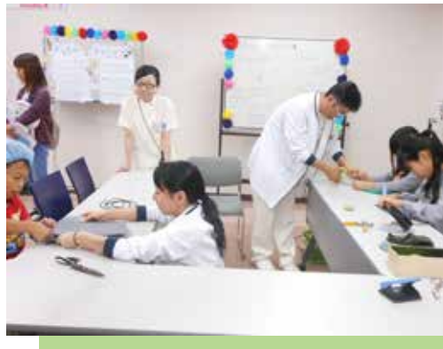
オッ！と楽しんで かがまずはけるソックスエイド