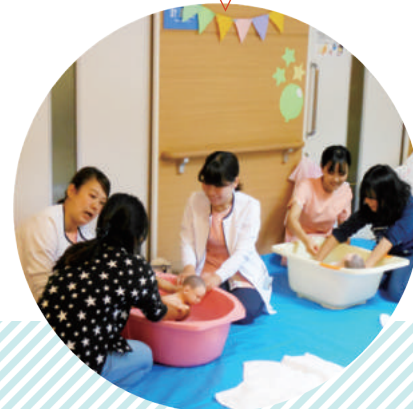
赤ちゃんのお世話体験