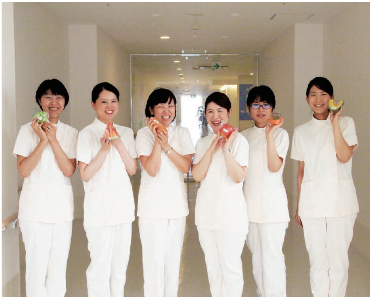
府中病院 管理栄養士