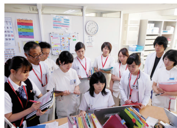
緩和ケアラウンド