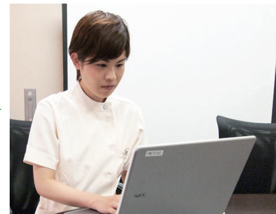
入院患者さんのカルテチェック、病棟での朝礼・申し送りにも参加