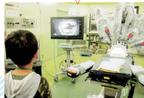
手術室のダビンチ見学