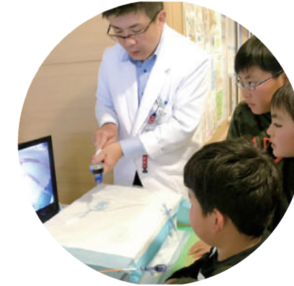
心臓カテーテル体験