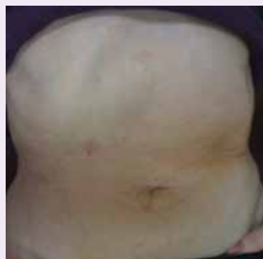
術後の創は目立ちません