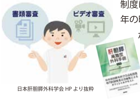
日本肝胆膵外科学会 HP より抜粋

がら泉州医療圏にはわずか 1 名で、指導医の先生も 2 名しかおられませんでしたし、この専門医を養成できる肝胆膵外科修練施設はありません。泉州医療圏の人口から考えると、これまで地域内で肝胆膵外科診療・教育が十分に行えていなかったのではないかと考えられます。