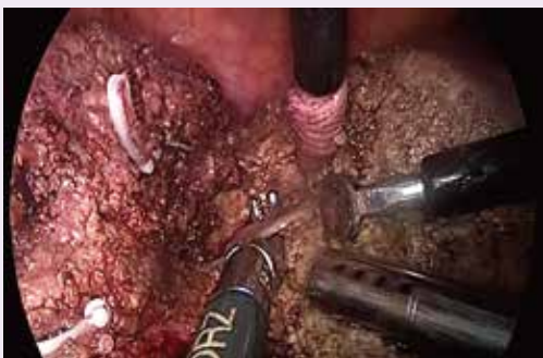
腹腔鏡下の肝切除術

的に取り入れております。 現在府中病院では 腹腔鏡下肝切除・膵体尾部切除 も行っています。