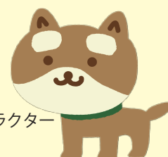
生長会イメージキャラクター にこまる